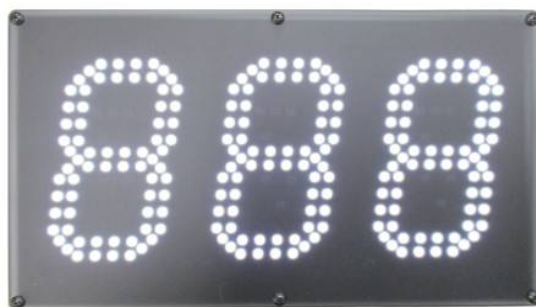
[ 表示器本体(表面) ]