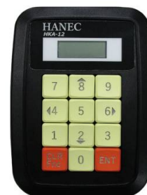
[ 操作卓 ]